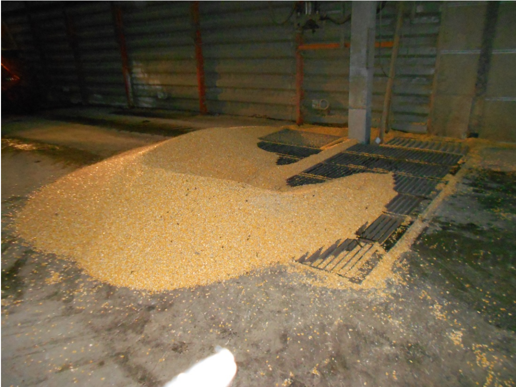
Figur 4. Majsen kommer i siloen via korngrav.