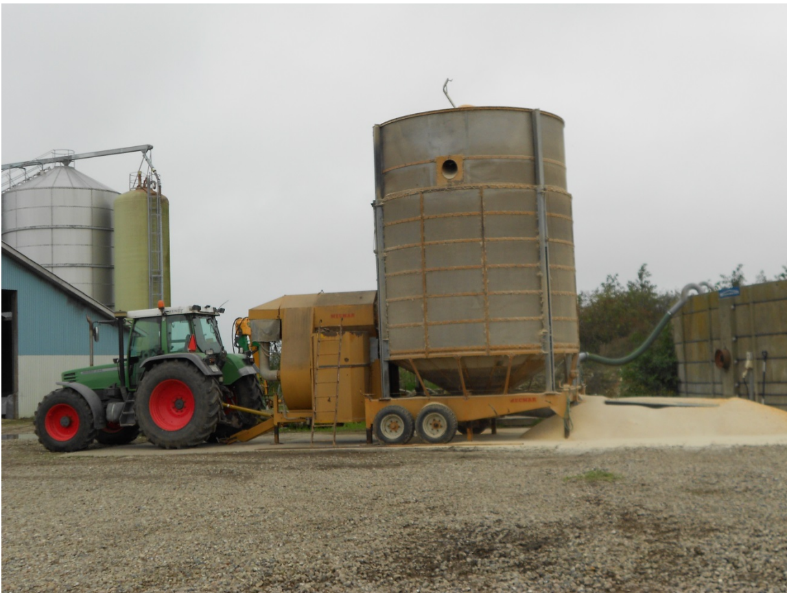
Figur 3. Majshøsten i 2014 blev så god at der var pladsmangel i den gastætte silo, så en del af høsten blev tørret ned til lagerfasthed ved 15 procent vand.