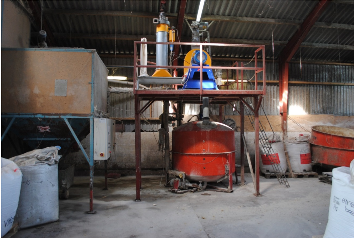
Figur 6. Majsen formales i slaglemølle til blandekar og pumpes over i vådfoderblandekar.