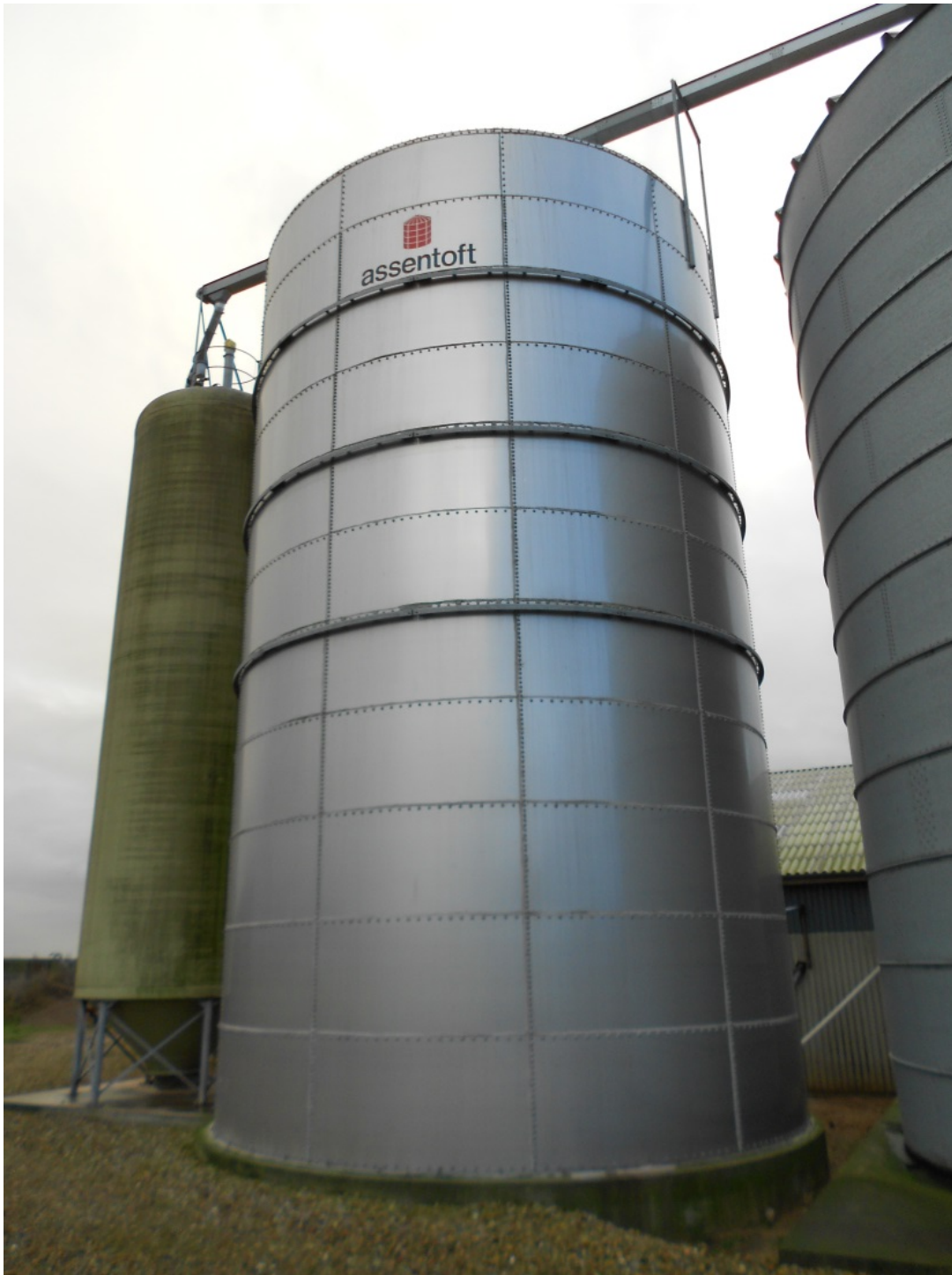
Figur 5. Gastæt silo. Kernemajsen lagres i hele kerner.