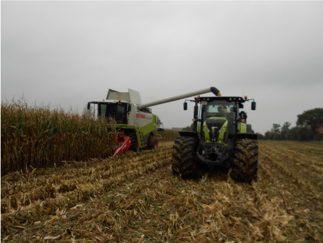
Figur 2. Majsen høstes. Mejetærskeren er udstyret med majsplukkebord.